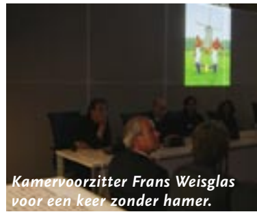
Kamervoorzitter Frans Weisglas voor een keer zonder hamer.